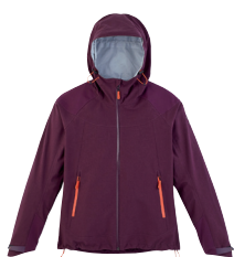
■ 1783 PURPLE